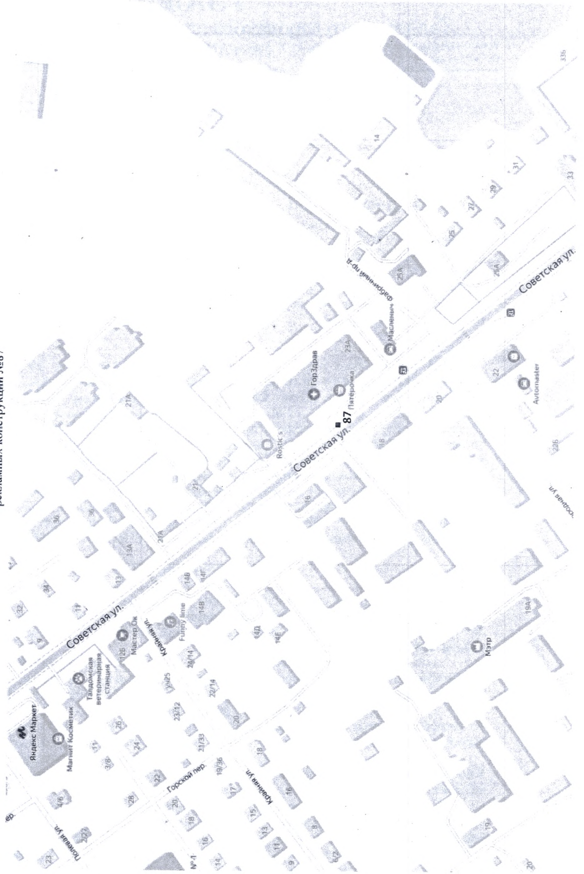
Схема размещения рекламных конструкций №87