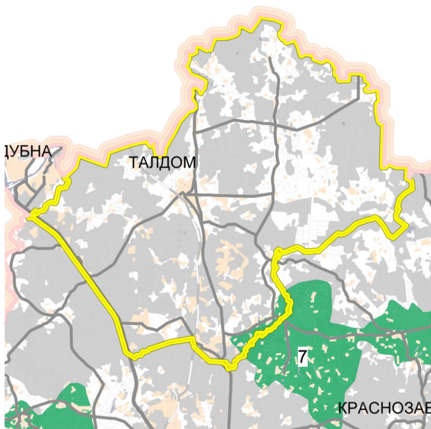
Рисунок 2.8.1. Фрагмент карты (схемы) планируемых особо охраняемых территорий – природных экологических территорий из Схемы территориального планирования Московской области – основных положений градостроительного развития

В соответствии с Законом Московской области от 07.03.2007 № 36/2007-ОЗ «О Генеральном плане развития Московской области», образование системы особо охраняемых природных территорий областного значения, а также природных экологических территорий для создания необходимых условий сохранения, восстановления, реабилитации и использования природных территорий Московской области предусматривается на основе выполнения следующих условий: