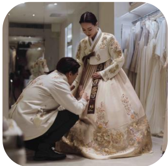
Примерка традиционного корейского костюма (люкс-ханбок)

Люкс-ханбок – это не просто одежда, это воплощение корейской души, застывшая в шелках и линиях. Это торжественный наряд, который надевали в особые моменты жизни – на свадьбы, праздники, церемонии, и он являлся символом статуса и благородства.