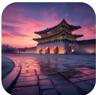
Посещение дворца Кёнбоккун (Gyeongbokgung)

Люкс-ханбок – это не просто одежда, это воплощение корейской души, застывшая в шелках и линиях. Это торжественный наряд, который надевали в особые моменты жизни – на свадьбы, праздники, церемонии, и он являлся символом статуса и благородства.