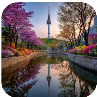
Площадь Кванхвамун и ручей Чхонгечхон

Кёнбоккун – сердце Сеула, величественный дворец, застывший во времени. Среди каменных стен и пышных садов оживает история династии Чосон. Яркие залы, изящные павильоны и тихий секретный сад создают атмосферу умиротворения и гармонии. Кёнбоккун – это поэма в камне, воплощение корейской красоты и величия.